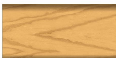
bezbarwny* nr art. 2652