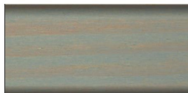
srebrnoszary nr art. 2609