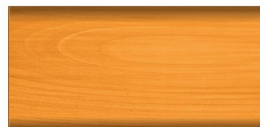
modrzew nr art. 2654