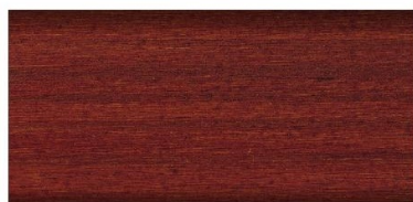
teak nr art. 2653