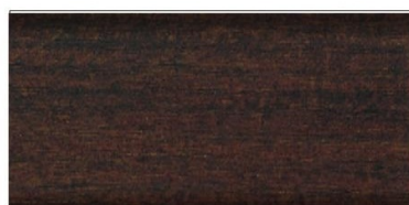
palisander nr art. 2606