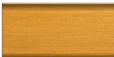
dąb jasny nr art. 2605