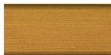
dąb rustykalny nr art. 2607