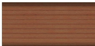
bangkirai nr art. 2655