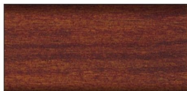
kasztan nr art. 2608