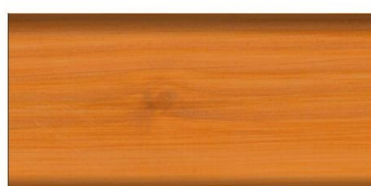
daglezja nr art. 2645