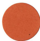
30 CILIEGIO KIRSCHBAUM