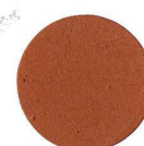
17 TEAK TEAK