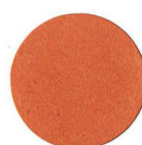
10 LARICE LÄRCHE