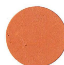
54 DOUGLAS DOUGLAS