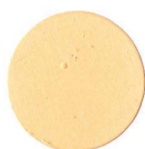
05 PINO KIEFER

BORMA WACHS® WOOD PROFESSIONAL COSMETICS