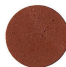
59 NOCE MEDIO NUSSBAUM MITTEL