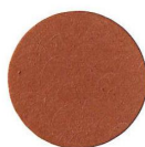
53 NOCE CHIARO NUSSBAUM HELL