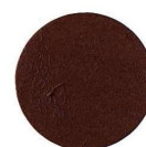
63 NOCE SCURO NUSSBAUM DUNKEL