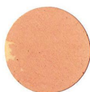
42 FAGGIO BUCHE