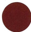
62 MOGANO MAHAGONI