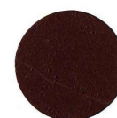
58 PALISSANDRO PALISANDER

Via E. Fermi 17 - 30020 Torre di Mosto (VE) Italy - Tel. +39 0421 951900 - Fax +39 0421 951902 - www.bormawachs.com - info@bormawachs.it