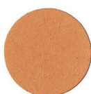
51 ROVERE EICHE